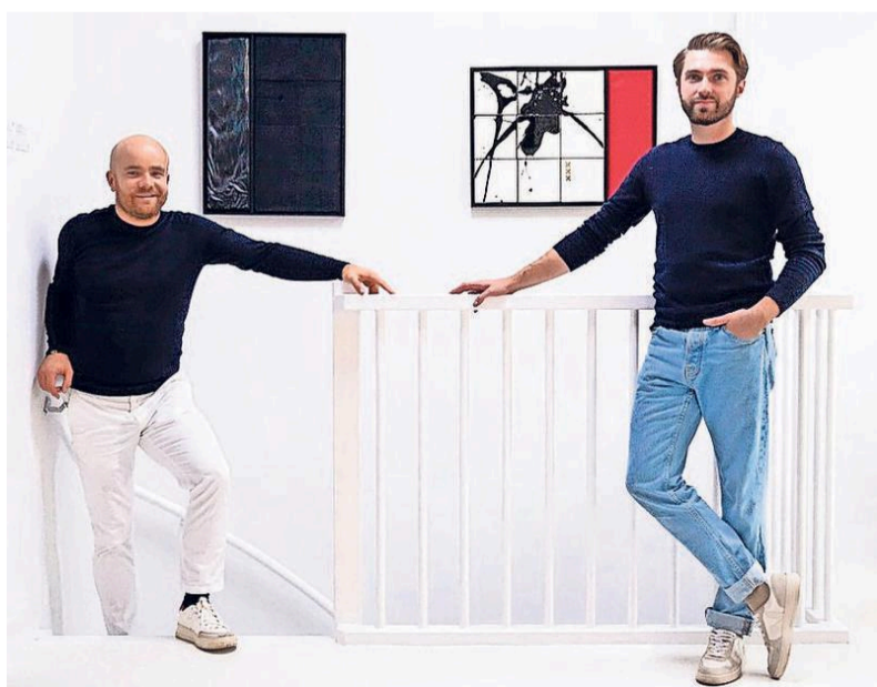
„Als we straks aan het werk gaan, wordt het weer een rommeltje.”

„Eerst maar de 'Wallenserie' afronden. Misschien dat we sommige werken in series, beperkte oplages gaan maken”, blikt Oko vooruit. Het duo is er helemaal klaar voor om 'buiten de deur' te exposeren. „We dromen ervan dat ons werk in een museumcollectie wordt opgenomen.”